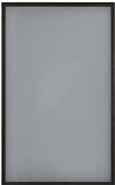
OMEGA con telaio alluminio sp.23 finitura antracite vetro fumè