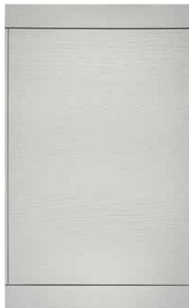
Laccata Cenere Ash Lacquer