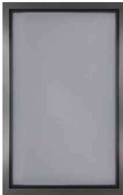
AIR con telaio alluminio sp.22 finitura antracite vetro fumè