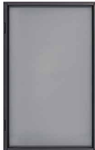
WILD con telaio alluminio sp.35 finitura antracite vetro fumè