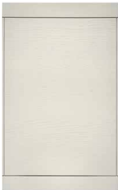
Laccata Corda Ecrú Lacquer