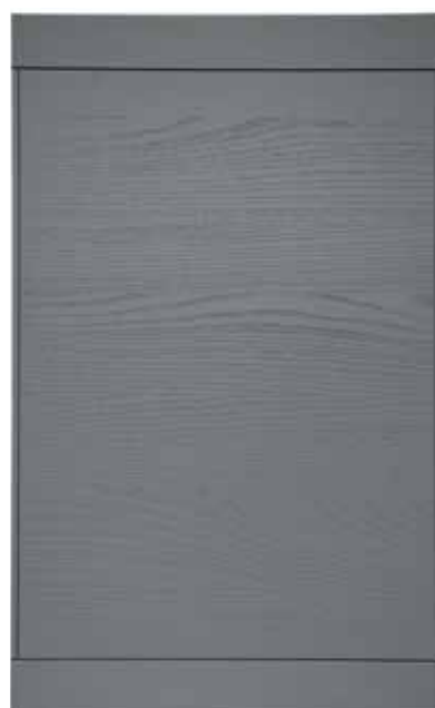
Laccata Carta da Zucchero Ice-Blue Lacquer