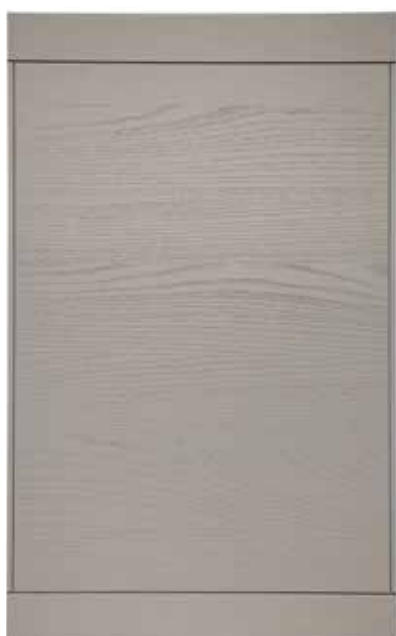
Laccata Platino Platinum Lacquer