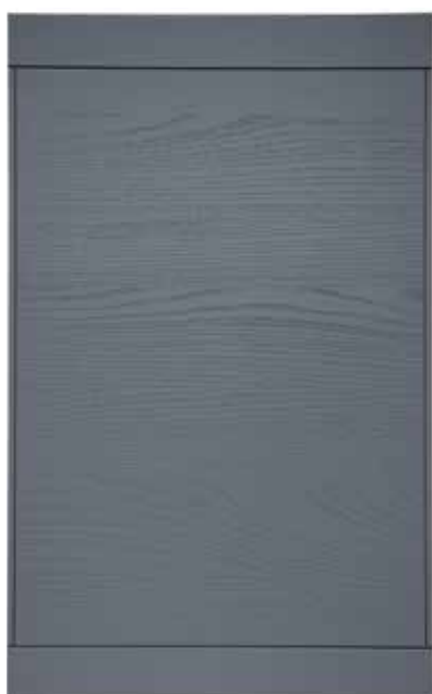
Laccata Iris Iris Blue Lacquer